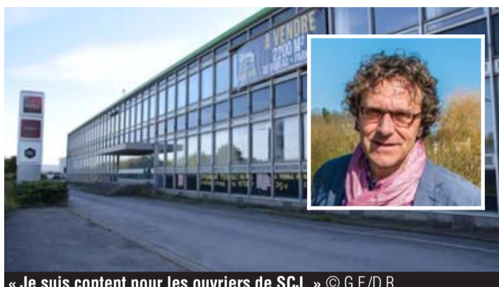
« Je suis content pour les ouvriers de SCJ. »

« La vente est reportée de trois mois. J'ai eu un contact avec le cabinet du Ministre wallon de l'Economie, Jean-Claude Marcourt, explique-t-il par téléphone. « Je suis vraiment content pour la région, pour l'emploi. » En effet, les 20 emplois de SCJ Stove Works